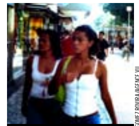
Dans les rues de São Paulo.

L'heure est au bilan, et il est positif. Depuis septembre 2006, la Région Île-de-France coopère avec la municipalité de São Paulo. À parts égales, elles financent un fonds de microcrédit à destination des quartiers les plus déshérités de la mégalopole brésilienne, où le système bancaire est inexistant. Sur place, une institution de crédit populaire - São Paulo Confia - a mis sur pied huit agences, où des aspirants entrepreneurs peuvent emprunter de l'argent pour réaliser leurs projets (salon de coiffure, épicerie...). En un an, 5000 personnes en ont profité, pour un montant de 160000 euros. Cette coopération doit se poursuivre et même s'approfondir dans la perspective de l'Année du Brésil en France en 2009. L'Île-de-France et São Paulo réfléchissent à des résidences d'artistes plasticiens de part et d'autre de l'Atlantique, ou à un soutien à l'éducation scientifique au Brésil. ●