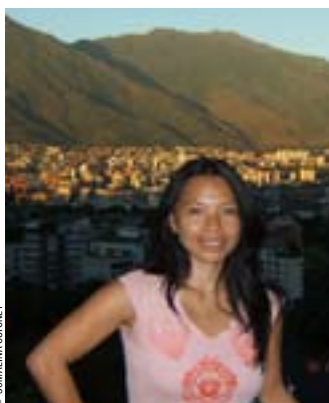
Même à Caracas, Somalina travaille avec Paris et l'Irlande.

S. GUIGNET : À Dublin, j'ai eu l'idée de monter une entreprise de conseil à l'achat de maisons en France. Je gère le tout depuis Caracas par Internet, avec mes associés en Irlande et à Paris. Je garde ainsi