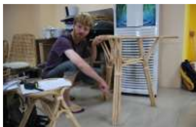
Stagiaire MOBIL'Asie, 7 e session

Dans l'accompagnement à l'insertion sociale et professionnelle, l'entreprise est un acteur incontournable qu'il convient de mobiliser dans la construction du projet et du parcours mais également en fin de parcours, en tant qu'objectif du projet des bénéficiaires. C'est ainsi que depuis près de 10 ans, BATIK International a construit un réseau de partenaires dans le monde économique. Ces partenaires sont des entreprises, essentiellement représentantes des PME, voire des SME mais aussi des fédérations, organismes consulaires (Chambres de métiers, Chambres de Commerce etc.). C'est au Vietnam, grâce au programme MOBIL'Asie que ce partenariat s'incarne de manière particulièrement forte, grâce à près d'une cinquantaine d'entreprises vietnamiennes ou étrangères de Hanoi mobilisées pour l'accueil de jeunes franciliens en recherche d'emploi. Ces entreprises sont clairement demandeuses des compétences des franciliens mais sont également volontaires pour accompagner et aider des jeunes en mal d'emploi et de confiance. Elles jouent – de façon certes inégale ou variable- un rôle qui va plus loin que la déclinaison d'une simple logique économique et ont un impact déterminant dans l'insertion de ces personnes en difficulté. En France également, et toujours grâce au programme MOBIL'Asie dans sa version réciprocity, des entreprises franciliennes se mobilisent pour permettre à de jeunes vietnamiens d'expérimenter un environnement de travail neuf et très formateur.