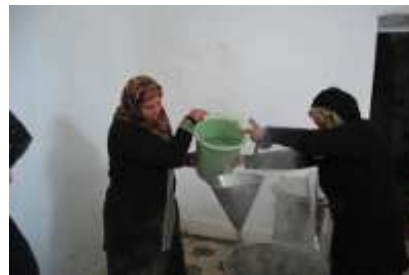
Bénéficiaires GEPE en Tunisie

Les projets d'Activités Génératrices de Revenus mis en place tant dans le monde arabe (coopérative de textile FEE à Tunis, filière de savon noir au Maroc, coopératives des villages de la Province de Hà Giang au Vietnam) s'inscrivent pleinement dans cette dynamique. Une organisation économique a été mise en place pour permettre aux bénéficiaires, femmes sans qualification de Tunis, femmes agricultrices de la minorité Hmong, de générer des revenus supplémentaires pour les aider à sortir de la pauvreté, en accordant un accompagnement fort à la recherche de débouchés – garants de la viabilité économique des projets- comme à la dimension solidaire des actions (partage de décision, transparence de la gouvernance etc.).