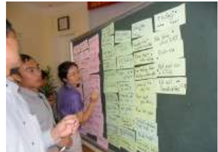
Formation réseau – Projet RSE & OSC, Vietnam

Un processus social de développement est presque toujours un processus pluri-acteurs qui ne fonctionne que si chaque acteur détient un minimum de forces et de compétences à mettre au service d'un projet collectif et qui le rendent apte à collaborer avec d'autres. Le changement social passe par le renforcement de groupes d'acteurs sociaux, économiques, publics et institutionnels, en vue de favoriser leur participation à l'élaboration et au suivi des programmes et politiques, du local à l'international. Des sociétés civiles mobilisées et crédibles aux yeux des populations, des pouvoirs publics et des bailleurs de fonds multilatéraux et bilatéraux, renforcent l'efficacité de l'aide publique au développement et la bonne gouvernance démocratique. Les populations, dont la voie est portée au sein d'organisations, sont davantage entendues dans leurs revendications et leurs besoins.