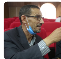
Directeur de l'ODEJ