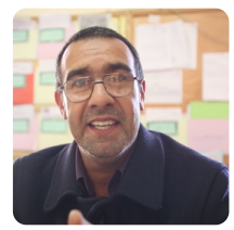
Directeur d'établissement géré par l'ASSIL

“ Je suis pour une perception plus libre de l'école ”